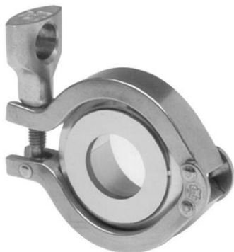
Wziernik wbudowany w króćcie Clamp, kompletny z klamrą, typ SV

Wyjątkowe wykonanie tych wzierników pozwala na montaż bezpośrednio na innym króćcu Clamp. Szkło jest wbudowane w część metalową (pierścień) – dostępne są 2 typy wzierników: ze standardową powierzchnią szkła (SV) oraz powiększoną powierzchnią szkła (LV). Są stosowane do złączy Clamp wg DIN 32676 / ISO 2852.