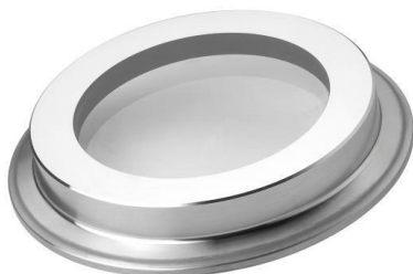
Wziernik wbudowany w króćcie Clamp, typ LV