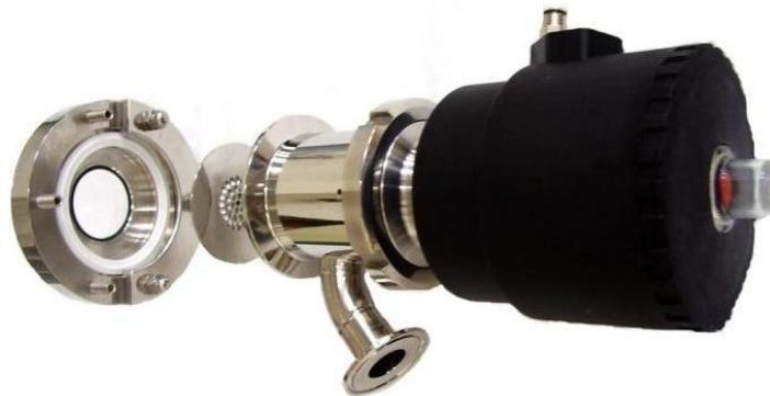
Zawór VFA z kołnierzem do montażu do zbiornika

Każdy zawór jest oznaczony logo producenta, wskazaniem kierunku przepływu, materiałem wykonania oraz numerem wytopu dla pełnej identyfikacji.