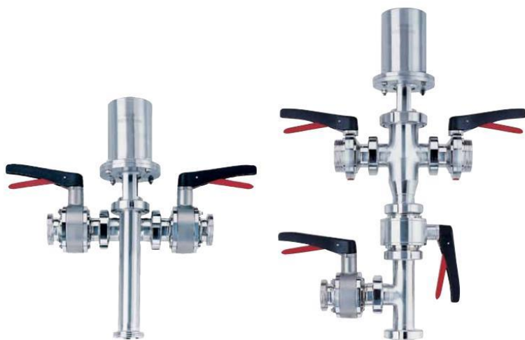
Stacja nadawcza i stacja odbiorcza systemu